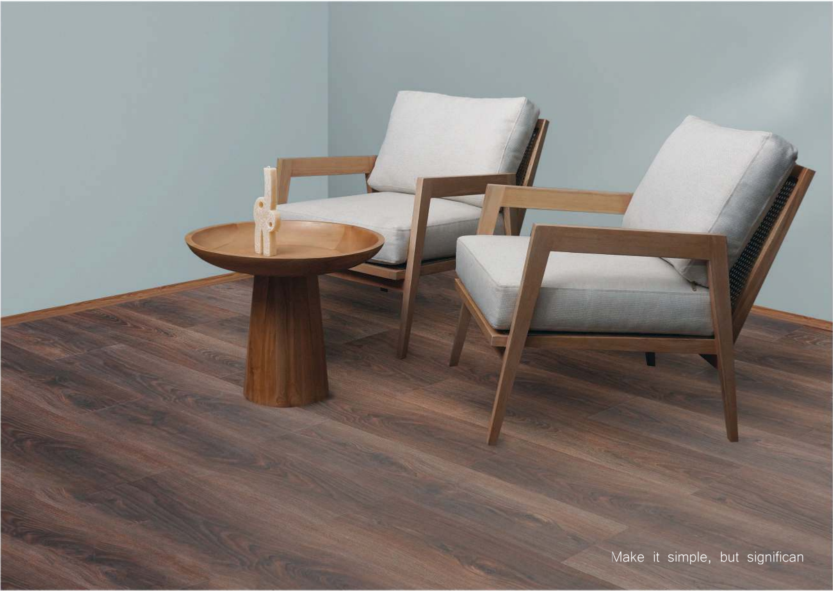
Make it simple, but significant